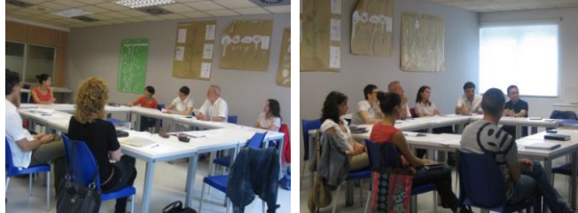
Responsables de formació i gestió de persones a l' Associació St. Tomàs

S'han mantingut els grups de treball (estratègia, operativa, àrea atenció a les persones) i s'han potenciat nous grups (Trastorn mental, formació i informàtica).