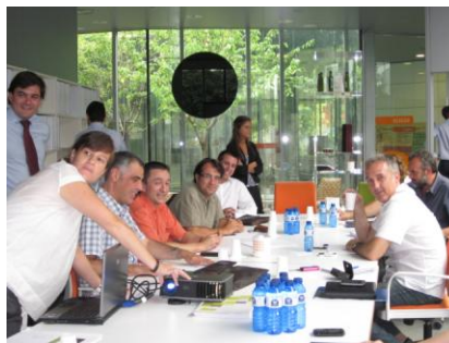
Equip de Sinergup amb consultors d'everis a la Fundació Alícia

Moltes han estat les sessions de treball al voltant d'aquest tema (evolució del mercat, producció ecològica, comercialització i distribució de cistelles...), i ens anima a crear noves línies de negoci que ens permetin millorar l'ocupació i la qualitat de vida de les persones amb discapacitat i/o trastorn mental.