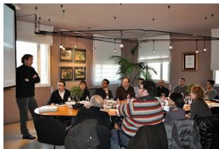
Visita a AMPANS: Presentació Entigest

Aquesta iniciativa és una aposta clara per la innovació i la millora de qualitat en la gestió de la informació dels nostres serveis d'atenció a les persones i que pretén ser una eina que faciliti la feina dels nostres professionals.