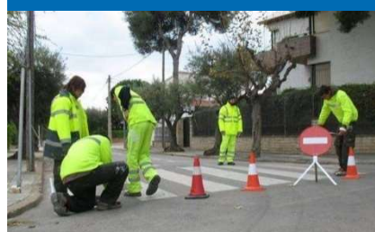
Pintura, senyalització vial i manteniment d'àrees de jocs infantils