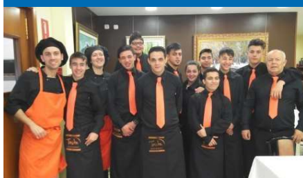
Serveis turístics i de restauració