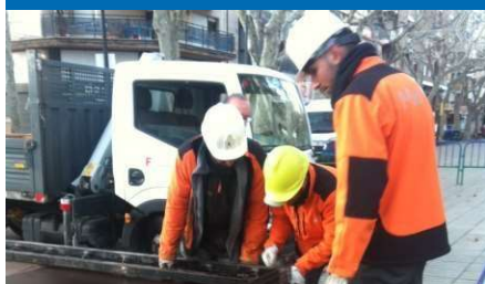
Suport a esdeveniments