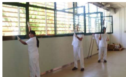
Neteja i manteniment d'espais