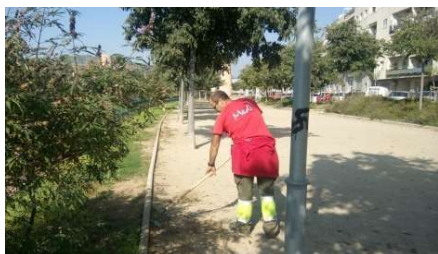
Jardineria i treballs al medi natural

Les entitats Fundalis apliquem un sistema integral de gestió que garanteix la qualitat dels nostres treballs i la seguretat dels treballadors i treballadores. Tenim experiència i flexibilitat per buscar solucions i crear noves oportunitats a partir de diferents necessitats professionals.